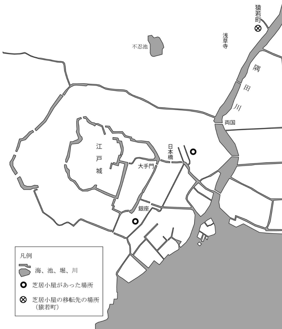
図1 歌舞伎の主要な芝居小屋の位置