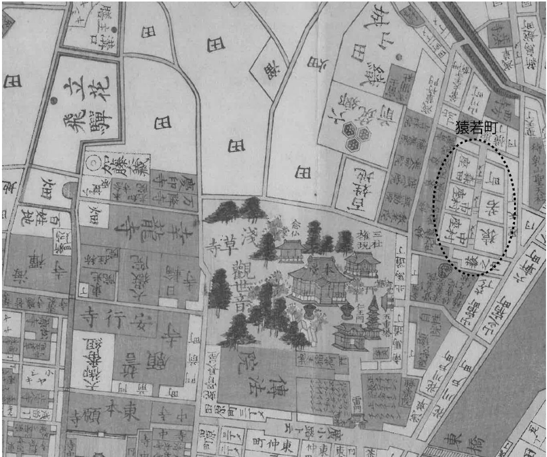
図2 19世紀中頃の浅草寺周辺の絵図 (安政6年 浅草・向島『五千分の一 江戸-東京市街地図集成』の一部)